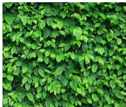
Hainbuche ( Carpinus betulus )

bis Mai eine spannende Heckenpflanze. Osmanthus hat sich gerade die letzten Hitzesommer hindurch als sehr widerstandsfähig und trockenresistent gezeigt. Bei sehr kalten Wintern können Triebspitzen aber schon mal zurückfrieren. Schnitt von Hand oder maschinell einmal im Jahr reicht.