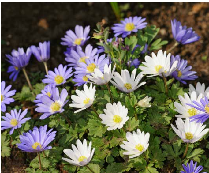
Anemone blanda. Die Ameisen verteilen die kleinen Knöllchen im Boden und tragen so zur Verbreitung der Pflanze bei.

Da es bis in den April hinein Frost geben kann, vergessen Sie bitte nicht, nach dem Giessen die Wasserhähne wieder winterfest zu machen, um Schäden zu vermeiden.