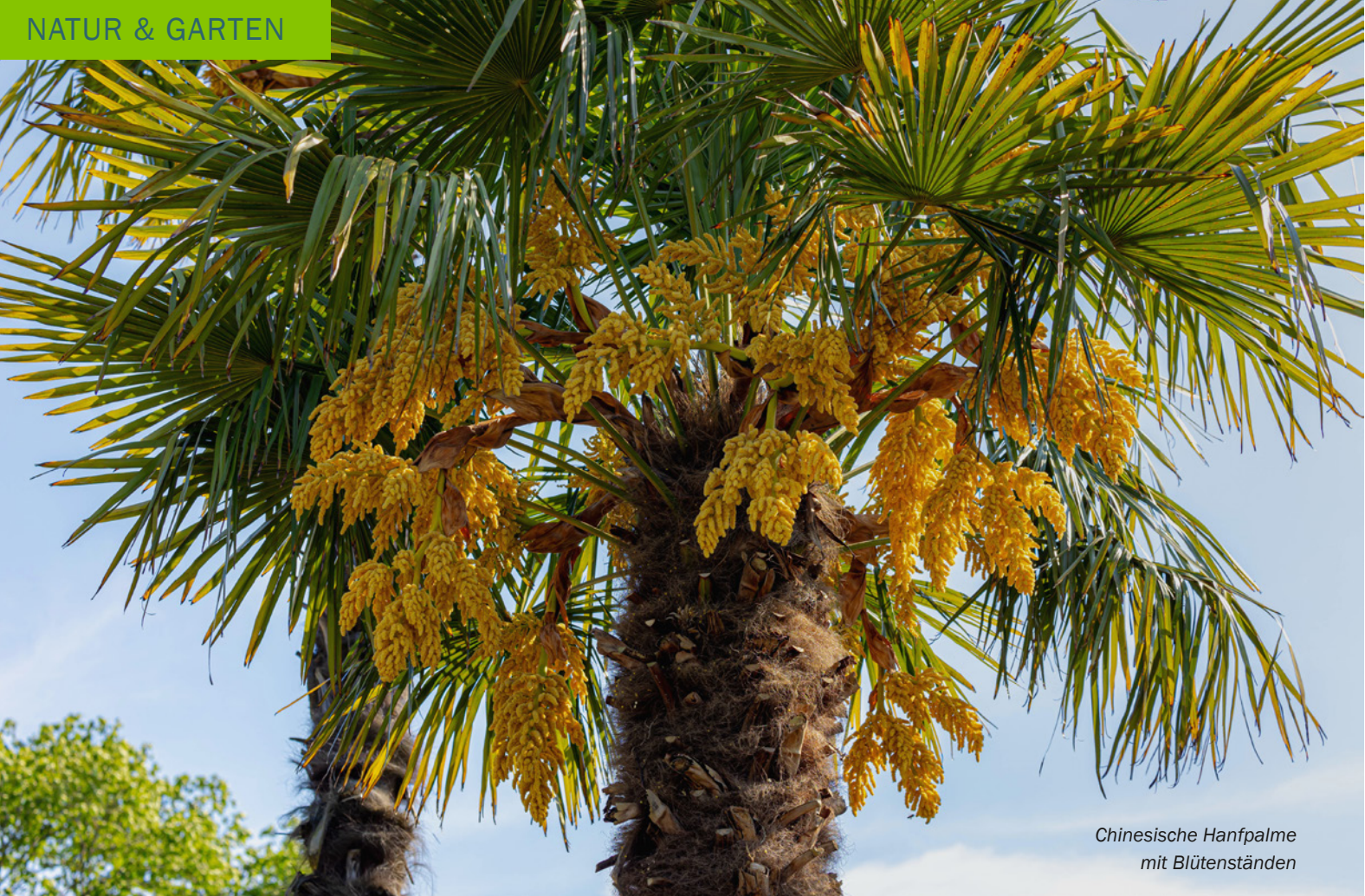
Chinesische Hanfpalme mit Blütenständen